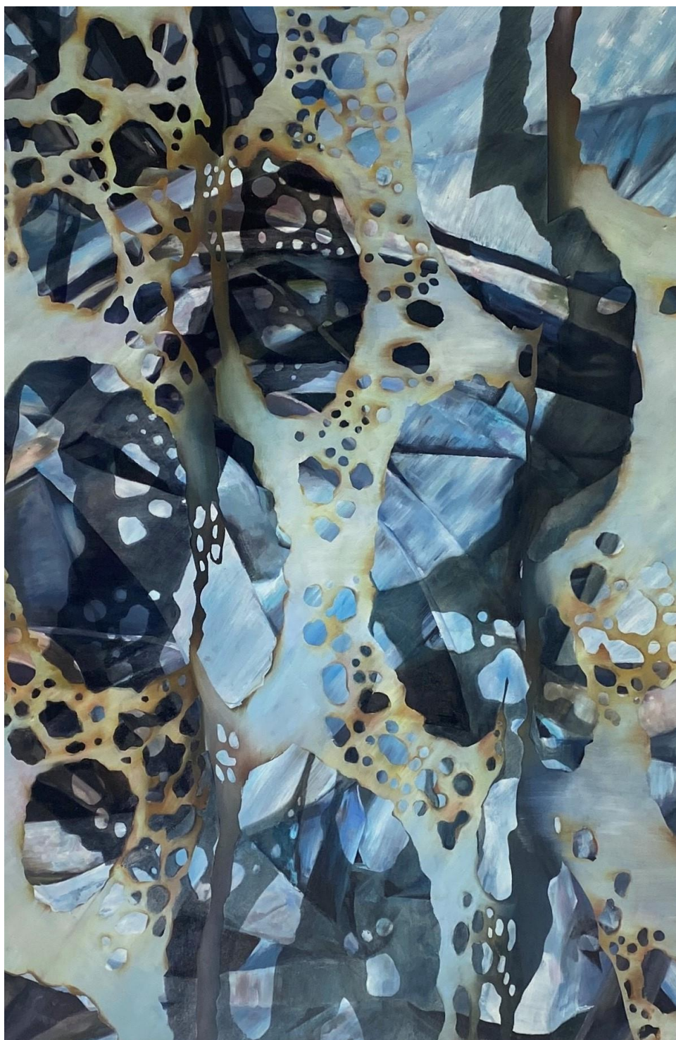
Šarūnas Baltrukonis Nemanmetal , 2024 Aliejiniai dažai, drobė / Oil on canvas 150 x 100 cm