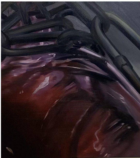
Šarūnas Baltrukonis Bound , 2023 Aliejiniai dažai, drobė / Oil on canvas 40 x 40 cm