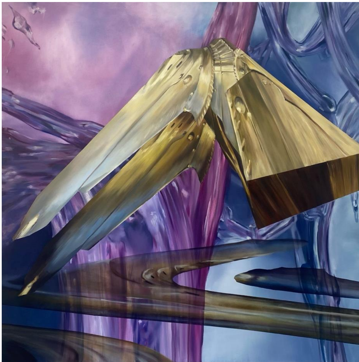
Šarūnas Baltrukonis Lurkless, 2024 Aliejiniai dažai, drobė / Oil on canvas 150 x 150 cm