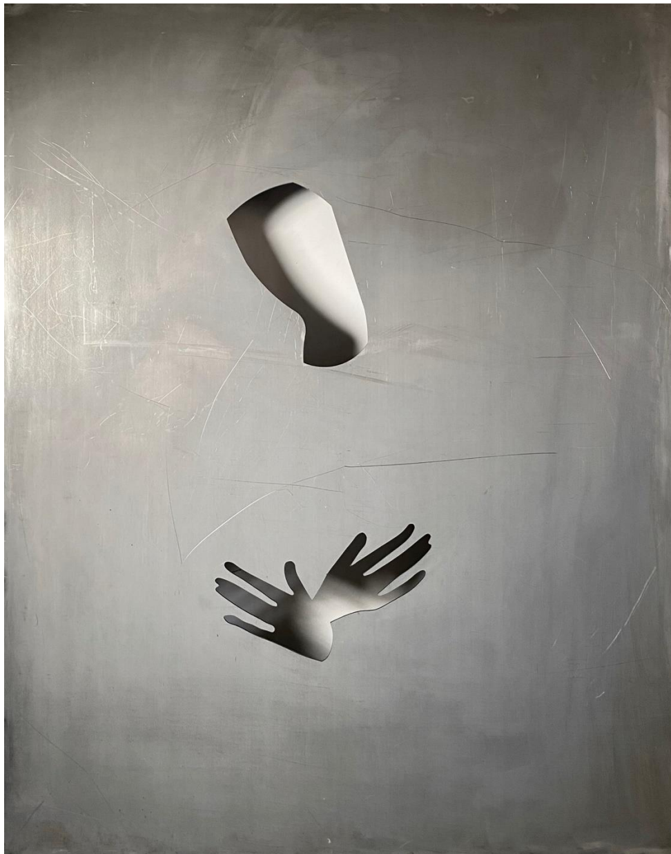
Agata Orlovska The Armour of Our Lady of the Dawn, 2024 Plienas, lazerio pjovimas / Stainless steel 179 x 142 x 4 cm

Kaina / Price : 4 500 eur Rezervuota / Reserved