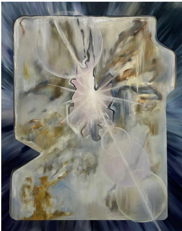
Šarūnas Baltrukonis SIM , 2024 Aliejiniai dažai, drobė / Oil on canvas 100 x 80 cm