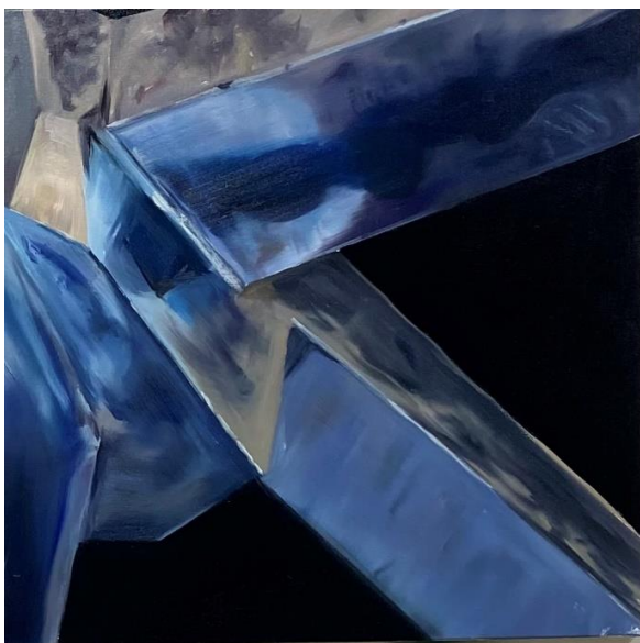
Šarūnas Baltrukonis Jointed ends , 2023 Aliejiniai dažai, drobė / Oil on canvas 40 x 40 cm