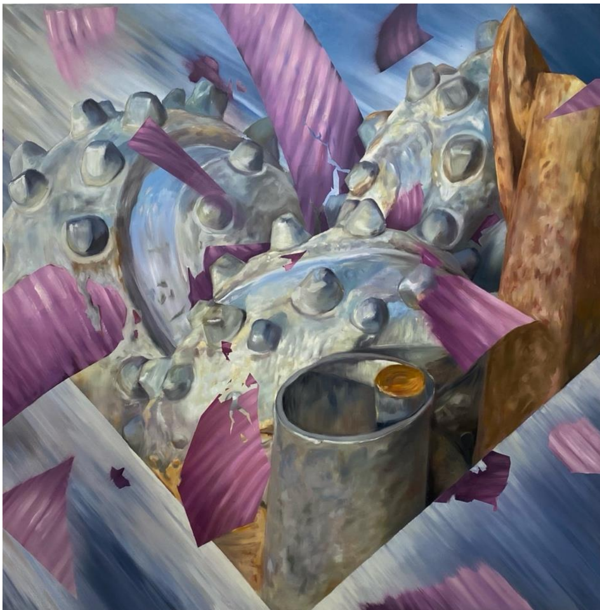
Šarūnas Baltrukonis Shredded luv , 2023 Aliejiniai dažai, drobė / Oil on canvas 150 x 150 cm